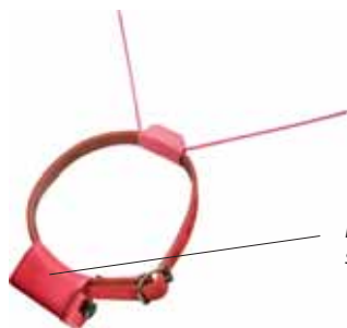
Standard Sändarhalsband DFT2004i

Placera batterierna i sändaren, 2 st lithium 3,6V storlek AA.