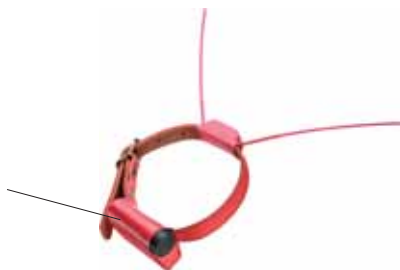
Litet Sändarhalsband DFT2004iS

Placera batterierna i sändaren, 2 st lithium 3,6V storlek 1/2 AA.